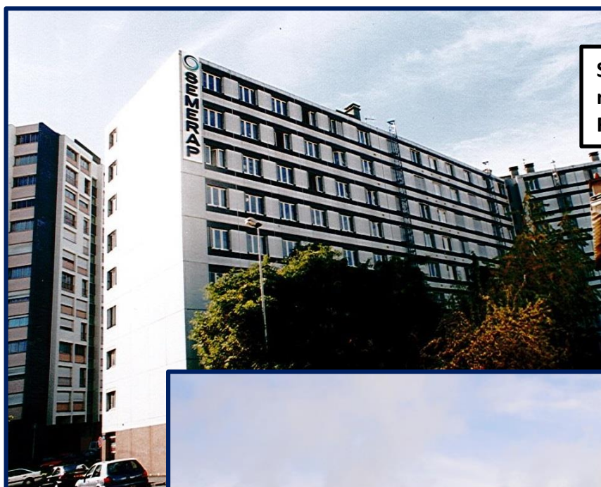
Siège social de la SEMERAP, rue Saint Simon à Clermont Ferrand

Elle va garder ces locaux jusqu'à leur cession en 2010. Son siège est alors transféré à RIOM au Parc Européen des Entreprises - rue Richard Wagner.