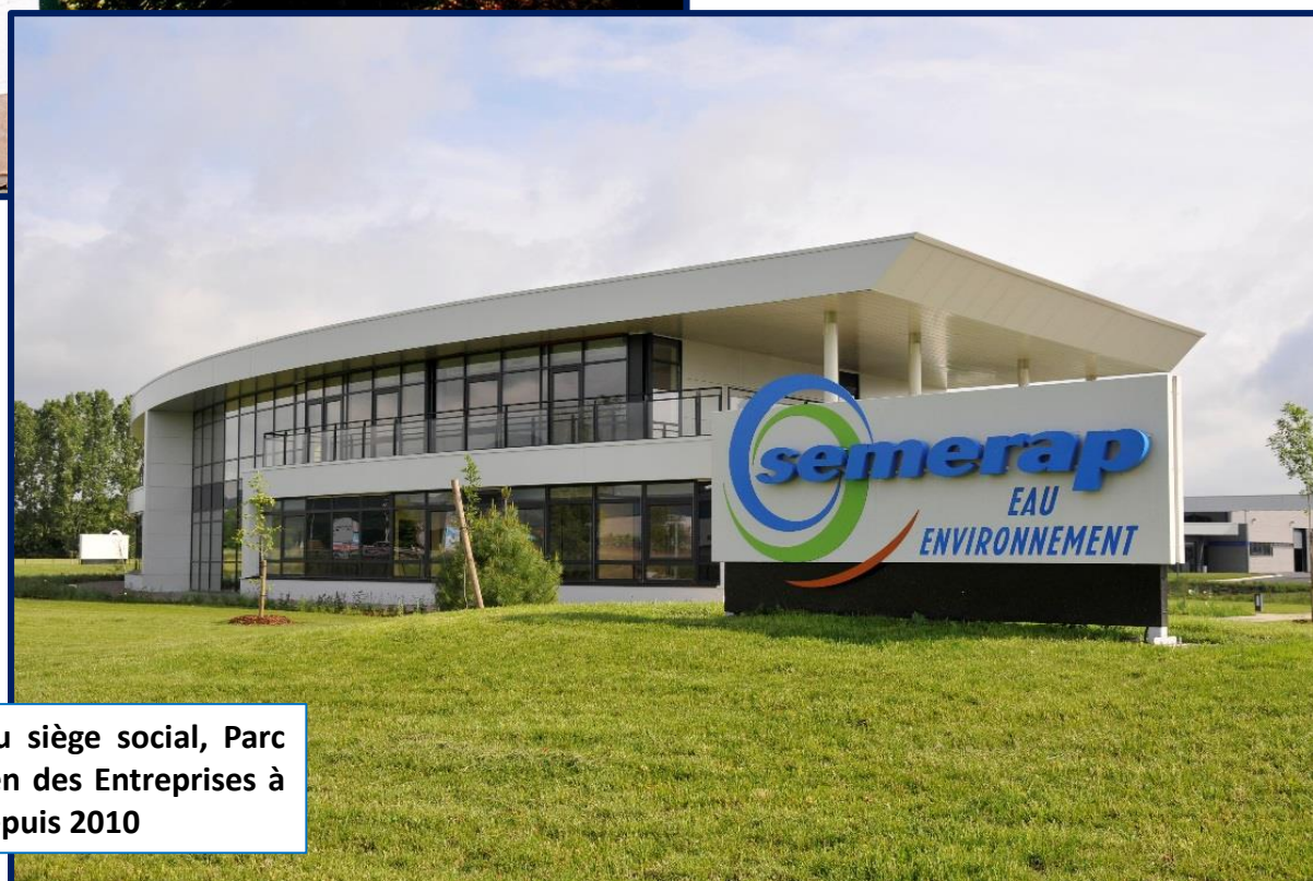
Nouveau siège social, Parc Européen des Entreprises à Riom depuis 2010